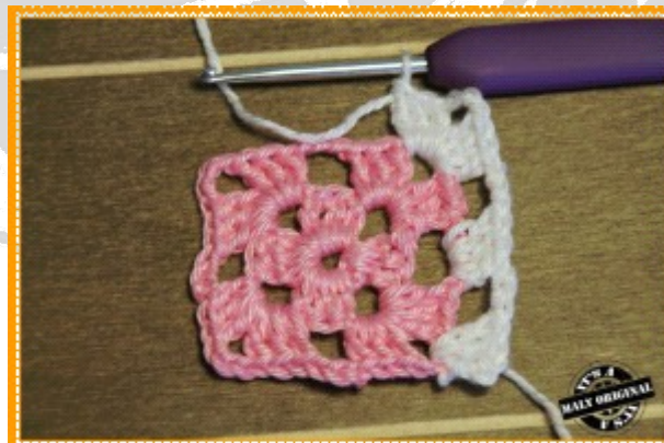
Foto toer 4