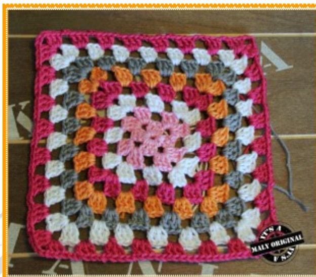
Foto van granny square na toer 9

* Haak op de zijden telkens 3 stokjes om de lossenboog en 2 lossen. In de hoek haak je weer 3 stokjes, 3 lossen, 3 stokjes, 3 lossen. * Herhaal * * tot je weer bij het beginpunt komt en sluit af met een halve vaste. Hecht af.