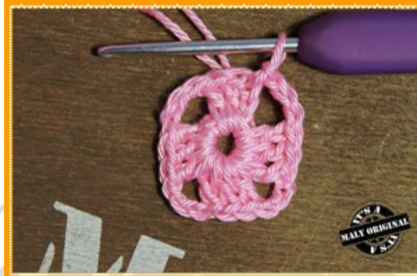
Foto toer 2