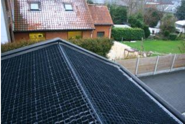
voorbeeld bij de nok