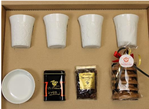
Set Oude Meesters voor Cultuur Oost

Afgelopen jaar hebben we aan meerdere opdrachten en nieuwe producties kunnen werken. De bekertjes Oude Meesters die we in 2021 voor De Onderwijsspecialisten hebben gemaakt, maken nu deel uit van ons assortiment. En die vallen goed in de smaak want ze worden volop besteld door diverse museumwinkels. Tevens hebben we samengestelde kerstpakketten en goodie bags geleverd aan leuke bedrijven en organisaties zoals Woonmensen, Restauratiefonds, Triaspect, Nedap, Siza Vrijwilligers, Siza Raad van Bestuur, Siza Werk, City Store Arnhem, Cultuur Oost en het Rijksmuseum. Begin november waren we op de Cultuur Retail Netwerkdag in het Cobra Museum Amstelveen uitgenodigd om tafelrondes te leiden over productontwikkeling & inclusie. Tal van musea sloten aan ter inspiratie. Tevens weten veel ontwerpers en organisaties ons te vinden voor wat kleinere deelproducties die uitstekend aansluiten bij de wensen en activeringsmogelijkheden van cliënt medewerkers. Dat zijn vaak leuke en dynamische samenwerkingen!