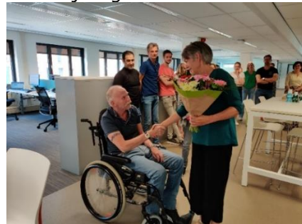
Schuin afsnijden, lauw water!