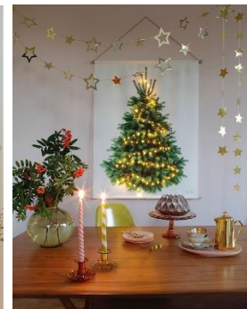
Tiny trees Suseela Gorter