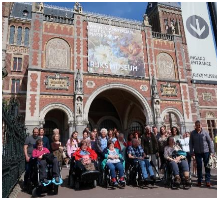
De keramiek op bezoek bij het Rijks