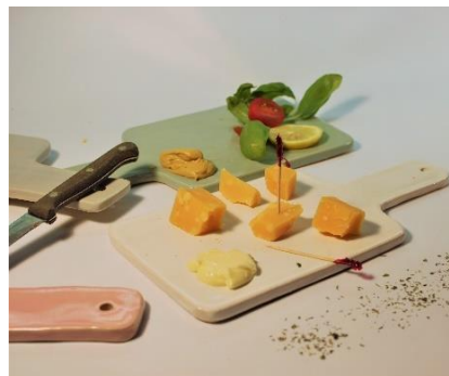
Borrelplankje Siza Vrijwilligers