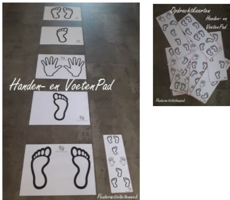
Handen-en VoetenPad | *Educatieve Opdrachtkaarten | Peuteractiviteitenweb