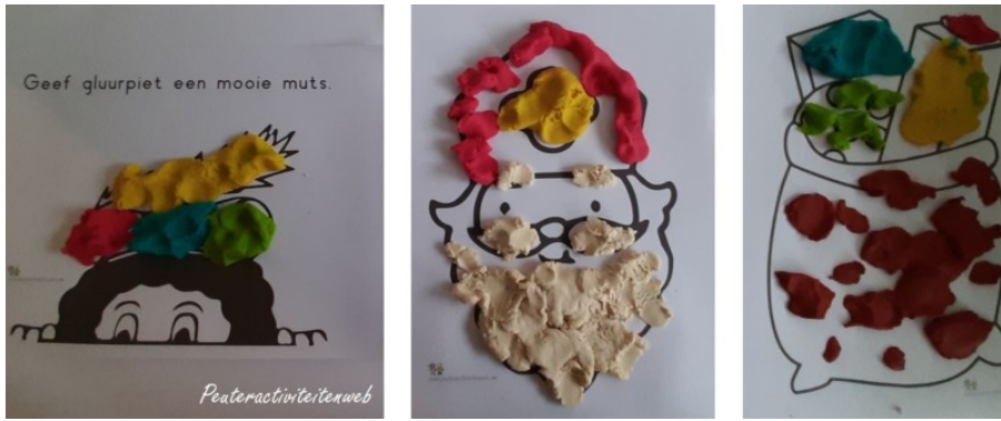
Sint kleikaarten | *Educatieve Opdrachtkaarten | Peuteractiviteitenweb