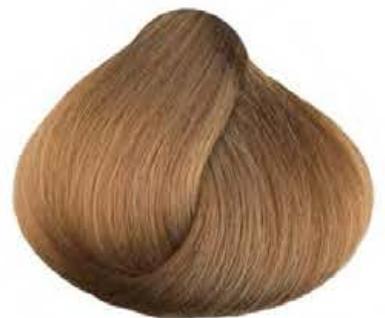
8.32 TABACCO CHIARO LIGHT TOBACCO TABACO CLARO TABAC CLAIR