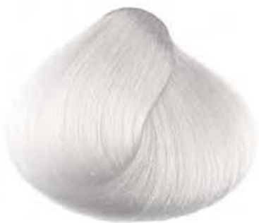
000 NEUTRO NEUTRAL NEUTRO NEUTRE