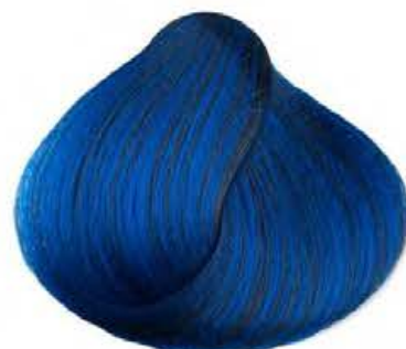
Blu BLUE AZUL BLEU