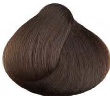
5.032 CIOCCOLATO MEDIO MEDIUM CHOCOLATE CHOCOLATE MEDIO CHOCOLAT MOYEN