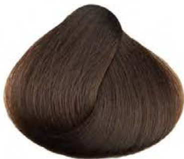
6.34 UVETTA RAISIN UVA PASA RAISIN SEC