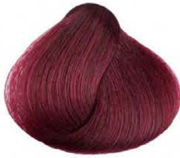
Fucsia FUCHSIA MAGENTA