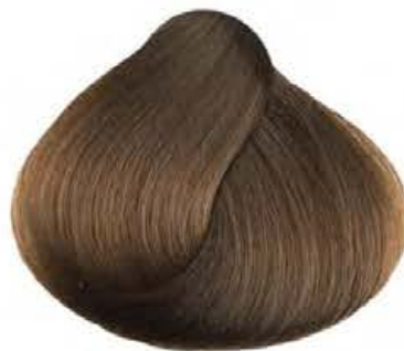
7.32 TABACCO TOBACCO TABACO TABAC