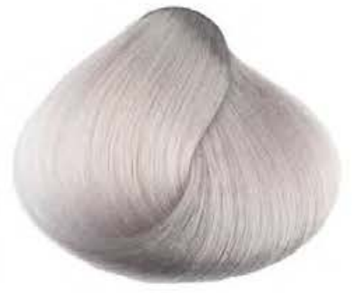
Perla PEARL PERLE