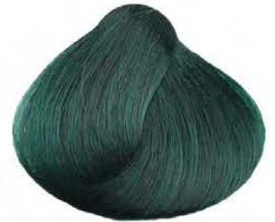
Verde GREEN VERT