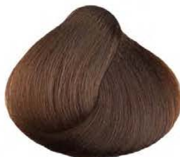
6.032 CIOCCOLATO CHIARO LIGHT CHOCOLATE CHOCOLATE CLARO CHOCOLAT CLAIR