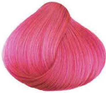
Rosa PINK ROSE