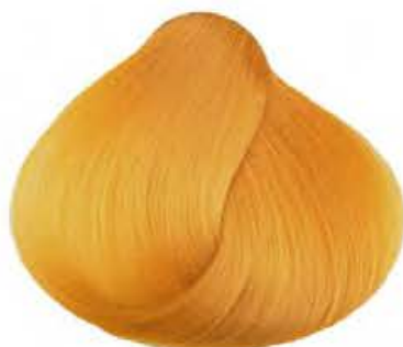
Giallo YELLOW AMARILLO JAUNE