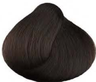
4.032 CIOCCOLATO SCURO DARK CHOCOLATE CHOCOLATE OSCURO CHOCOLAT FONCÉ