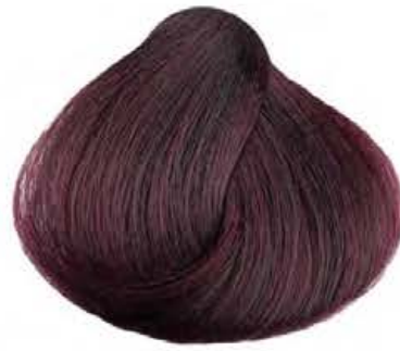
4.26 PRUGNA PLUM CIRUELA PRUNE