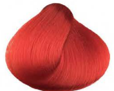
Extra Rosso EXTRA RED ROJO EXTRA EXTRA ROUGE