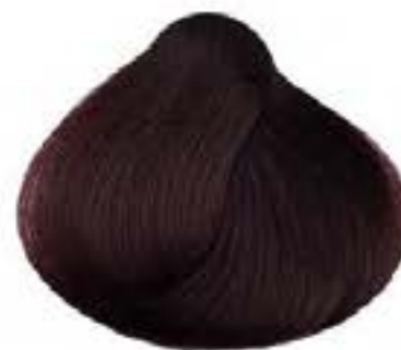
CASTANO CHIARO MOGANO LIGHT MAHOGANY BROWN CASTANO CLARO CAOBA CHÂTAIN CLAIR ACAJOU KASTANO ANIKTO AKAZOY