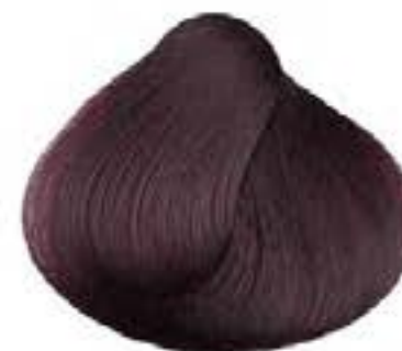
CASTANO IRISÉ VIOLET BROWN CASTANO IRISADO CHÂTAIN IRISÉ ISMET KASTANO