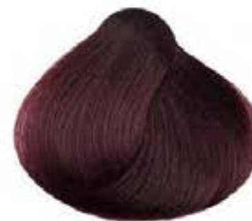
BIONDO SCURO MOGANO DARK MAHOGANY BLONDE RUBIO OSCURO CAOBA BLOND FONCE ACAJOU ZANGO SKOYPO AKAZOY