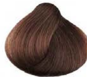
BIONDO SCURO RAME DARK COPPER BLONDE RUBIO OSCURO COBRIZO BLOND FONCE CUIVRE ZANGO SKOYPO XAKINO