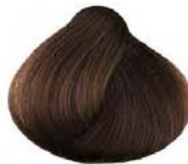
CASTANO CHIARO RAME LIGHT COPPER BROWN CASTANO CLARO COBRIZO CHÂTAIN CLAIR CUIVRE KASTANO ANIKTO XAKINO