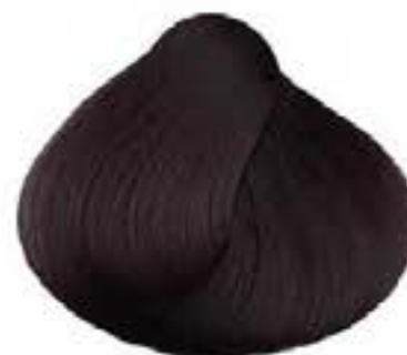
NERO VIOLA VIOLET BLACK NOIR VIOLET NEGRO VIOLETA ISMET MAYPO