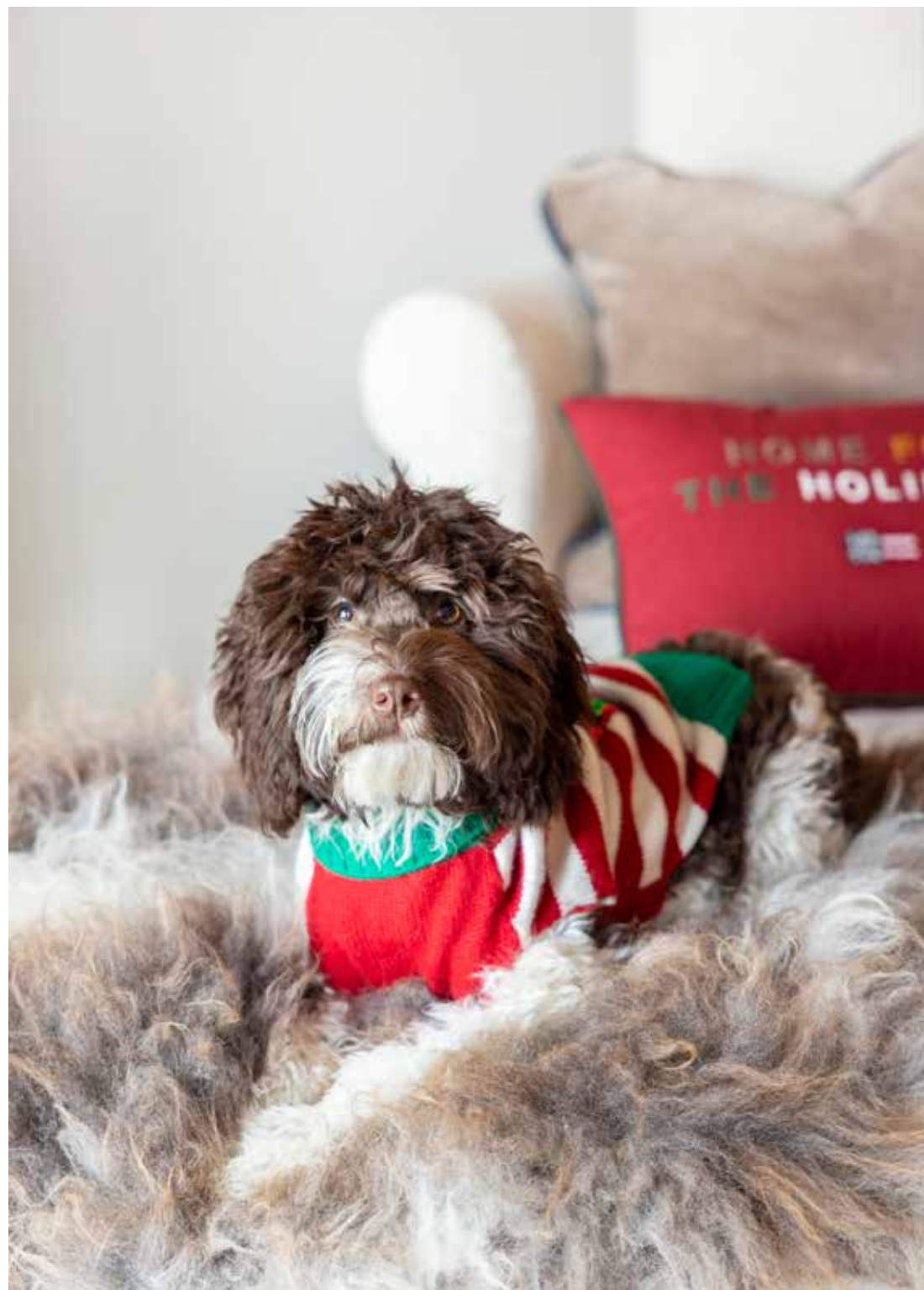
Ook hond Guusje is helemaal in kerstfeer.

“Stef en ik vinden het fijn dat we onze eigen droomsfeer hebben kunnen maken”