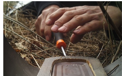
Het prikken van een gaatje