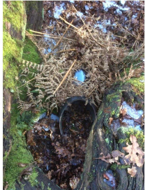
Struikrover® in het veld

Matthijs Smaal doet nog steeds uitgebreid onderzoek met de Struikrover . Wil je deze onderzoeksresultaten volgen, kijk dan regelmatig op zijn Facebookpagina .