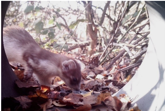
Hermelijn in overgangskleed

De Afgemonteerde Struikrover wordt geleverd inclusief een Browning 2013 Strike Force HD PRO X 1028 cameraval met lens. Bij de Struikrover op maat – bouw pakket kun je zelf een cameraval inbouwen. Bij de Struikrover op maat – ingebouwd stuur je de cameraval op, zodat wij de camera inbouwen. Bij de Afgemonteerde Struikrover is de Browning cameraval geselecteerd op zijn bouw, reactiesnelheid en kwaliteit van de beelden. De Browning is nagenoeg geruisloos en produceert (infrarood)flitslicht, waar dieren niet van schrikken. De camera kan ook in de filmstand worden gebruikt, maar dan is de reactietijd, zoals reeds vermeld, trager.